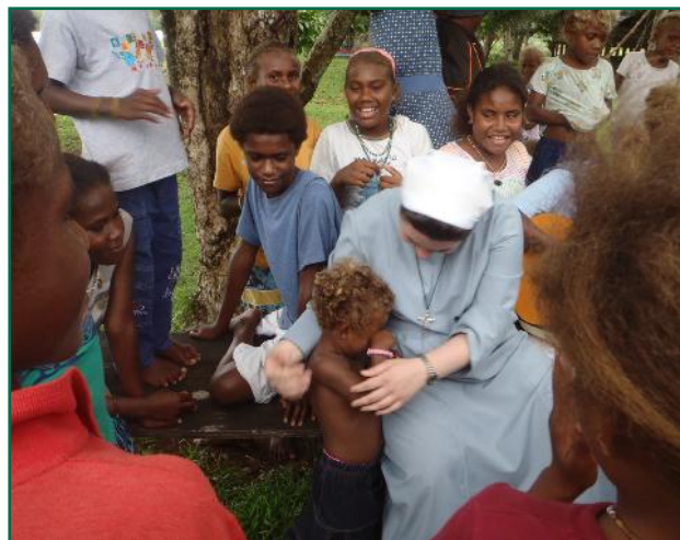
s. Marinka na Salomonskim otocima

Kateheze kao i dodatni materijali bit će dostupni na internetskoj stranici Nacionalne uprave Papinskih misijskih djela u Republici Hrvatskoj ( www.misije.hr )