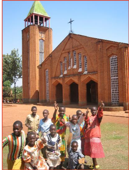
Djeca ispred crkve u Burundiju

Opće poslanje uključuje svakoga, sve i uvijek. Evanđelje nije isključivo dobro onoga koji ga je primio, već je dar koji se mora dijeliti, lijepa vijest koju treba proslaviti. I taj dar-obaveza je povjerena ne samo nekima, već svim krštenima koji su "rod izabrani... sveti puk, narod stečeni da naviještate silna djela Onoga koji vas iz tame pozva k divnom svjetlu svojemu" (1 Pt 2, 9). Ono uključuje također sve vrste djelovanja. Pozornost i surađivanje u evangelizacijskom djelu Crkve u svijetu ne mogu se ograničiti na neke trenutke ili posebne prigode, niti ih se jednako tako smije smatrati jednom od mnogih pastoralnih aktivnosti: misionarska dimenzija