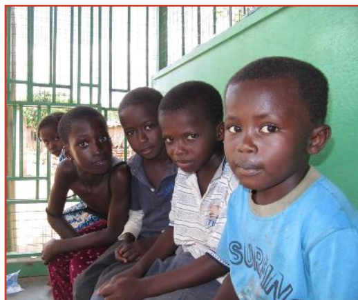
Djeca iz Gane