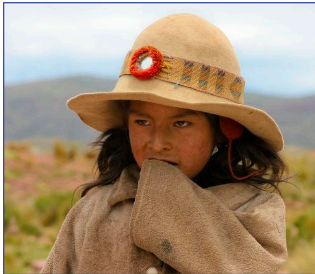
Djevojčica iz Bolivije

Možemo reći da je to ujedno temeljni odgojni put svakog kršćanina koji misijski djeluje u svojoj sredini jer ga se prepoznaje po onome što jest i kako živi. Nemojmo se dati zvesti jednostavnošću navedenog jer Isus primjerom pokazuje da istinski hod započinje prihvaćanjem i življenjem iskustva odricanja i služenja koji predstavljaju temelj za rast i jačanje unutarnje snage svake osobe. Tek tada se rađa unutrašnji mir koji daje žar naviještanja da se upozna i uzljubi Crkva, mi-