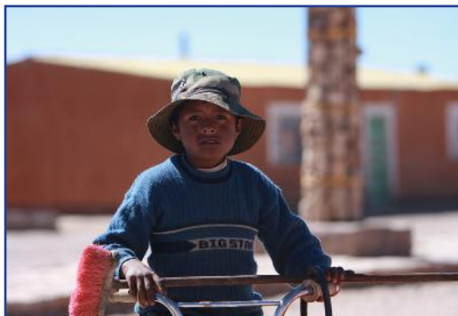
Dječak iz Bolivije

Razmišljajući o misijama i medijima, vrlo bismo lako mogli doći do zaključka da je fotografija ili eventualno neki video zapis najbolji medij koji može dočarati misijske potrebe i to prikazujući ljudsku patnju i bijedu. Je li to uistinu privilegirani način služenja medijima u misijskom poslanju Crkve? Neosporiva je potreba da se senzibiliziraju osobe i zajednice za duhovne i materijalne potrebe drugih, bilo da su u našoj neposrednoj blizini, bilo da su u dalekim zemljama te nemamo nikakav drugi doticaj s njima osim preko fotografije i filma koji su nam prikazali njihovu potrebu. Jasno je, međutim, da komunikacijski potencijali i potrebe medijskog djelovanja nadilaze spomenute oblike aktivnosti, kao što se ni naviještanje Radosne vijesti ne svodi samo na taj vid karitativnih aktivnosti, već je puno šire. O tome nam mogu posvjedočiti misionari koji u dalekim zemljama propovijedaju Evanđelje, kao i oni koji pronalaze načina da poruku Evanđelja približe današnjoj zapadnoj civilizaciji, obilježenoj individualizmom na svim razinama egzistencije. U ovom drugom govorimo o novoj evangeliza-