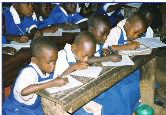
Učenici u Tanzaniji

Svako misijsko djelovanje po sebi je i odgojno te sadrži navedene elemente. Kako onda odgajati za misijsko djelovanje? Koji su modeli primjenjivi u odgoju za misijsko poslanje u suvremenom svijetu? Kako pomiriti djelovanje koje u sebi uključuje pomno organizirane aktivnosti i “mali put” sv. Male Terezije zaštitnice misija? Kako pomiriti stvarnost suvremenog čovjeka koji je bombardiran potrebama siromašnih u svijetu, a istovremeno pozvan kao i apostoli: “Ništa ne uzimajte na put: ni štapa, ni torbe, ni kruha, ni srebra! Niti imajte po dvije haljine” (Lk 9,3) da ipak misijski djeluje u župnoj zajednici, na radnom mjestu, u susretu s bližnjim?