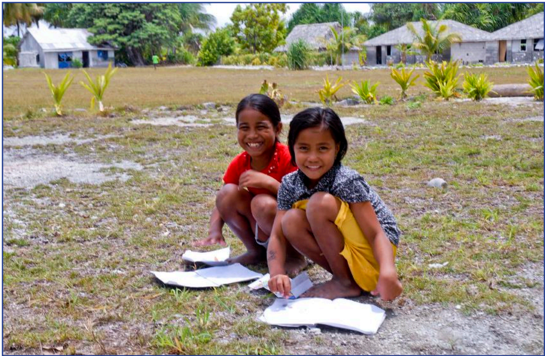
Učenice s otoka Fanning u Oceaniji

Te nove prilike sigurno uključuju neprestani napredak komunikacijskih i drugih tehnologija. Taj napredak, međutim, sam po sebi ne znači kvalitetniji život, kao ni poboljšanje međuljudske komunikacije ukoliko se njima odgovorno ne služi te može voditi prema naglašavanju individualizma, otuđenju pa čak i asocialnim nefunkcionalnim ponašanjima. Sveprisutnost medija možemo promatrati iz različitih perspektiva, spomenimo samo neke: perspektiva korisnika, komunikacijski potencijali, virtualni ambijent koji