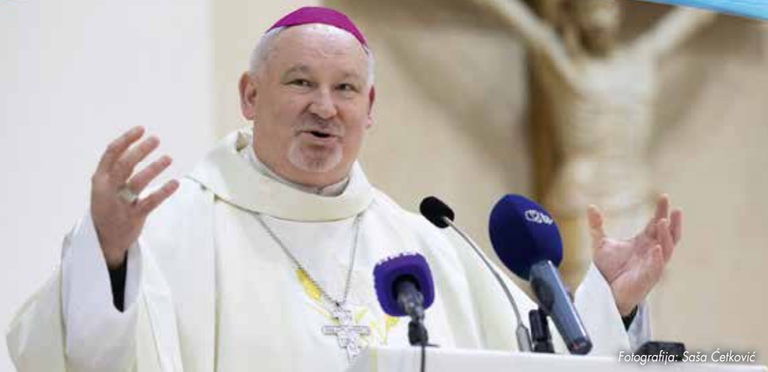
Fotografija: Saša Četković